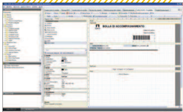
REPORT FRAMEWORK ↑